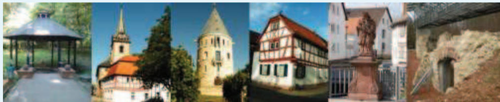
Die Wählergemeinschaft für Flörsheim und seine Stadtteile